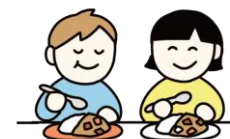
友達と一緒に食事を楽しむ