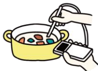
調理時の加熱の徹底(殺菌)