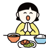
感謝の気持ちを育むマナー

給食の時間は、友達や先生と一緒に食べることで、協調性や社会性を育む大切な場です。「いただきます」「ごちそうさま」を通して、感謝の気持ちや食事のマナーを学びます。楽しい雰囲気の中で、食への興味を引き出し、自分で食べようとする意欲を伸ばします。