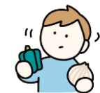
食べ物への興味・関心