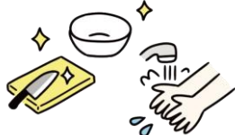
調理室での衛生管理