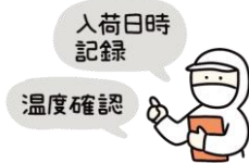
納入業者・食材の品質管理