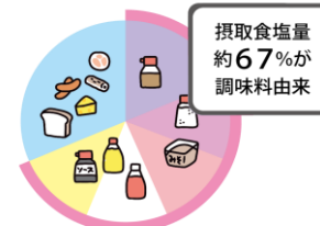
厚生労働省 令和元年 国民健康・栄養調査より作成

日本人が摂取している塩分のうち、調味料由来が67%となっています。減塩するには、「調理に使う調味料」、また「料理にかける食卓調味料」を減らすことが有効です。子どもが好きなマヨネーズ、ドレッシング、ケチャップ、ソースの使い過ぎには注意しましょう。